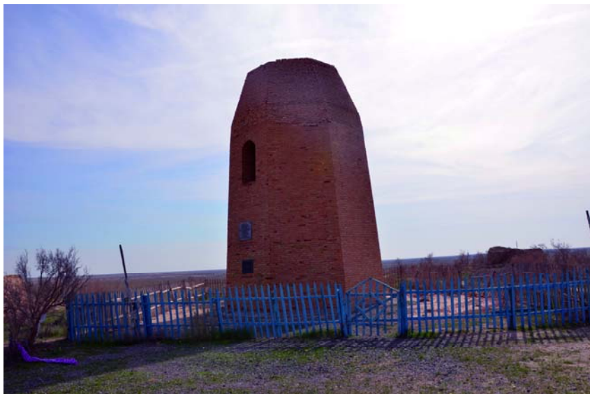
Рис. 1. Сооружение Бегим-Ана. X в. 2012 г.

Деггарон, Шабурган-ата (Пугаченкова Г.А., 1963, с. 30; Крюков К.С., 1964, с. 155–165). По мнению С.Г. Хмельницкого (1996, с. 48), квадратный кирпич со сторонами 20–23 см был характерен для построек среднеазиатского региона IX–X вв.