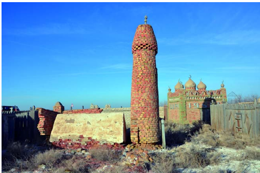
Рис. 7. Башнеобразный памятник в мусульманском кладбище с. Бирлик Казалинского района Кызылординской области.

Примечательно, что Э. Байтеновым были выявлены в Кызылординской области почти аналогичные огузским башням сооружения из сырца и обожженного кирпича у казахов XVIII–XX вв., воздвигнутые для душ умерших. Они также внутри не имеют следов захоронений (Байтенов Э., 1990, с. 337–344). Сооружения типа «дын» этнографического времени и небольших размеров зафиксированы и в Карагандинской области (Ошанов О.Ж., 2004, с. 97–99). В 70-х гг. XX в. в ряде узбекских поселений Южного Казахстана были выявлены небольшие башнеобразные сооружения для духов предков (Тайжанов К., Исмаилов Х., 1980, с. 87–93).