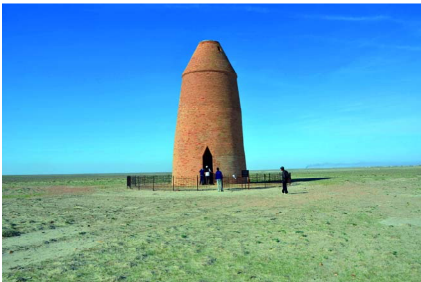
Рис. 4. Сооружение Сараман-Коса. XI в. 2012 г.

Сараман-Коса, Бегим-Ана и Узынтам архитектурными формами резко отличаются от синхронных по времени мусульманских мавзолеев Средней Азии. Сырдарьинские сооружения по времени близки с загадочной башней Ак-Сарай-Динг, которая располагается в северной части Туркмении и относится к XI–XII вв. (Хмельницкий С.Г., 1996, с. 160). В соответствии с туркменской легендой Ак-Сарай-Динг была возведена местным богачом, чья дочь умерла до того, как выйти замуж. Девушка явилась ему во сне и попросила его соорудить ей «кеджебе» – седло с балдахином, традиционно водружаемое на верблюда невесты во время туркменских свадебных процессий. Поэтому отец построил на могиле (?) дочери башню Ак-Сарай-Динг. По преданию, из-за боязни обрушения в начале XII в. нижний ярус башни был засыпан землей (Восстановление..., 2007, с. 33).