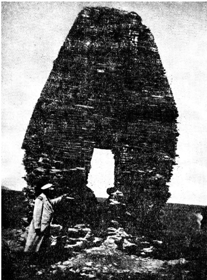
Рис. 6. Памятник Дынгек. IX в. Из книги Н. Пантусова 1902 г.

душа у тюркских народов представлялась в виде птицы: «...по турецким народным верованиям, душа обращалась в птицу или насекомое; об умершем говорится, что они улетают (учду)...» (Бартольд В.В., 1967, с. 30).