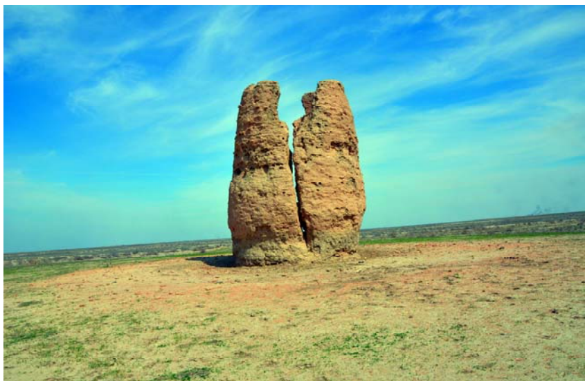
Рис. 2. Сооружение Узынтам. IX–X вв. Фото М. Кожя. 2012 г.

Менее чем в 15 км от Бегим-Ана располагается другая башня, известная как Узынтам. Сооружение в плане круглое, диаметр у основания около 7 м (рис. 2). Башня сооружена из сырцового кирпича размерами 22–23×22–23×5–5,5 см и имеет цилиндрическую, слегка сужающуюся в верхней части тело высотой до 10 м. Внутри располагается камера со сводчатым перекрытием. Выше сохранились остатки площадки, обнесенной парапетом.